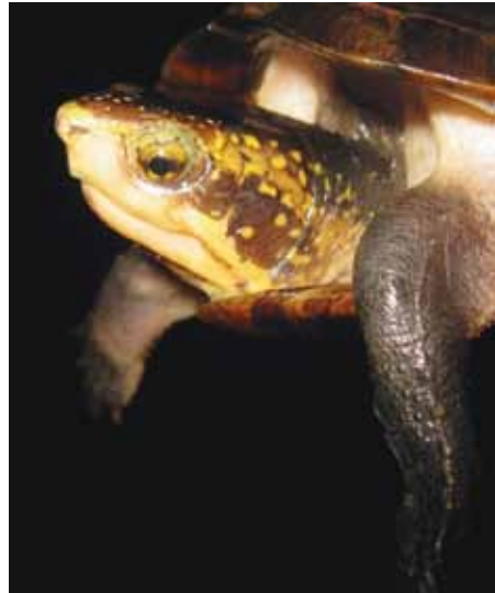
Figura 18. Detalle de la cabeza de Kinosternon leucostomum postinguinale . Ensenada de Utría, Chocó.

Kinosternon leucostomum puede distinguirse de otras especies del género por la combinación de las siguientes características: caparazón de ancho y alto intermedio; caparazón generalmente sin o con una qui-