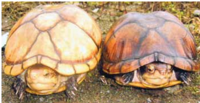
Figura 16. Variación en la coloración en Kinosternon leucostomum postinguinale . Río Cajambre, Valle del Cauca.

que la mitad de la longitud del lóbulo anterior del plastrón, en la mayoría de los especímenes los escudos axilares e inguinales no se tocan (Berry 1978, Acuña-M. 1993, Berry y Iverson 2001). Cabeza parda oscura sobre el dorso y amarillenta sobre el lado ventral, incluidas las mandíbulas que son de color crema (Figura 18). Listón ancho postorbital amarillo a cada lado del cuello, el cual tiende a perderse en los individuos adultos, en donde es remplazado por una mezcla de punteaduras amarillas y cafés (Medem 1962, Berry 1978, Berry y Iverson 2001, Rueda-A. et al. 2007); en las hembras adultas las bandas pueden mantenerse. Dos pares de barbillas mentonianas, el par anterior más largo que el posterior. Patas con palmeaduras bien desarrolladas (Rueda-A. et al. 2007). Los machos tienen la cola más larga, con una uña córnea en su extremo posterior (Figura 19). También, tiene un parche de tubérculos y escamas espinosas bien desarrolladas en la parte interna del muslo y pantorrilla; plastrón levemente cóncavo y la mandíbula superior fuertemente arqueada (Berry 1978, Berry y Iverson 2001). Medem (1962) menciona que en los machos la concha es más alargada y menos ancha que en