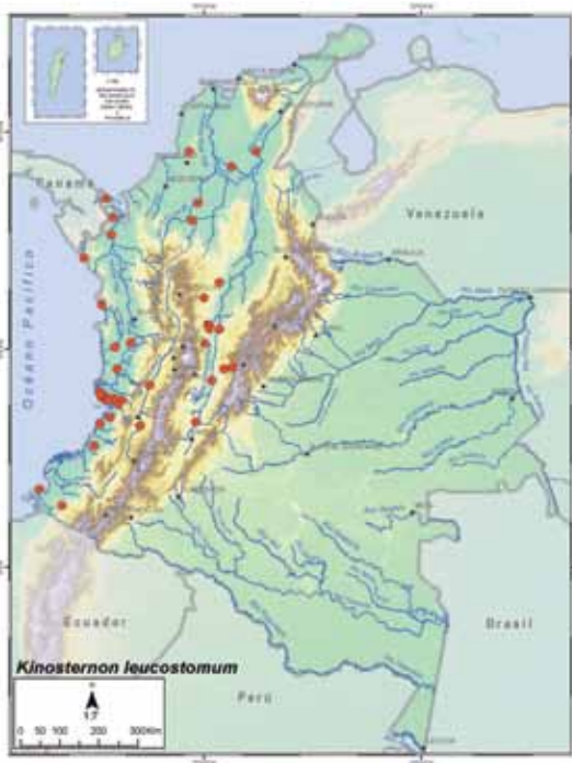
Registros de Kinosternon leucostomum

viduos deambulando en tierra firme muy lejos del agua, algunos ejemplares pueden estar en los bosques ribereños o enterrarse entre el fango y las raíces del pasto (Rueda-A. et al. 2007, Carr y Almendáriz datos sin publicar). En el Caribe comparte hábitat con K. scorpioides , Trachemys callirostris callirostris , Rhinoclemmys melanosterna y Mesoclemmys dahli ; en el Valle del río Magdalena con Podocnemis lewyana en las ciénagas (Castaño-M. et al. 2005); en el Valle del río Cauca con Chelydra acutirostris y en la llanura del Pacífico con K. dunni , R. melanosterna , R. nasuta , R. annulata y Chelydra acutirostris (Grupo de investigación de ecología animal de la Universidad del Valle-GIEA datos sin publicar, Forero com. pers.).