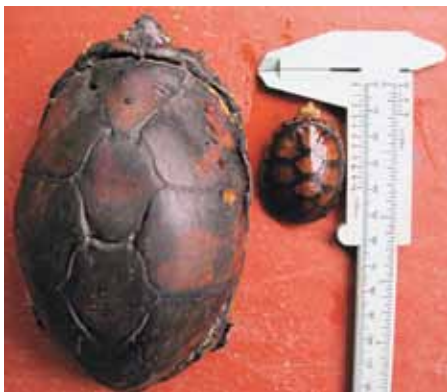
Figura 20. Adulto y juvenil de Kinosternon leucostomum postinguinale . Isla Palma, Valle del Cauca.

Tortuga pequeña, alcanza un tamaño máximo de 17 cm. La subespecie K. l.